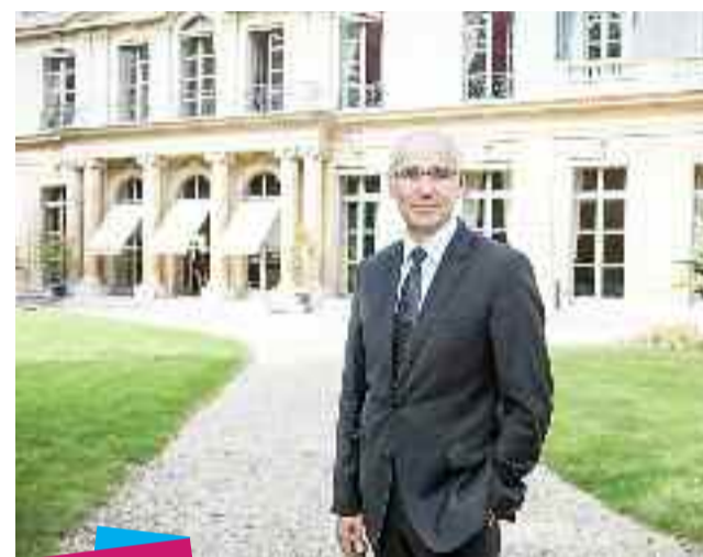
Thierry Repentin Ministre délégué auprès du ministre du Travail, de l'Emploi, de la Formation professionnelle et du Dialogue social

Il est effectivement prévu qu'un projet de loi soit présenté au Conseil des Ministres avant l'été. Son volet formation professionnelle portera principalement sur l'offre de formation et sa qualité et sur les modalités de mise en œuvre du compte personnel de formation issu de l'accord signé le 11 janvier par les partenaires sociaux. Ce projet de loi comportera un volet apprentissage qui traitera notamment de la taxe d'apprentissage. C'est un sujet complexe sur lequel nous sommes dans une phase de concertation large avec les nombreux acteurs concernés. Il s'agit de construire un mode de collecte et de répartition de la taxe qui soit à la fois plus simple, plus efficace et plus juste, avec une préoccupation particulière pour les formations visant les premiers niveaux de qualification.