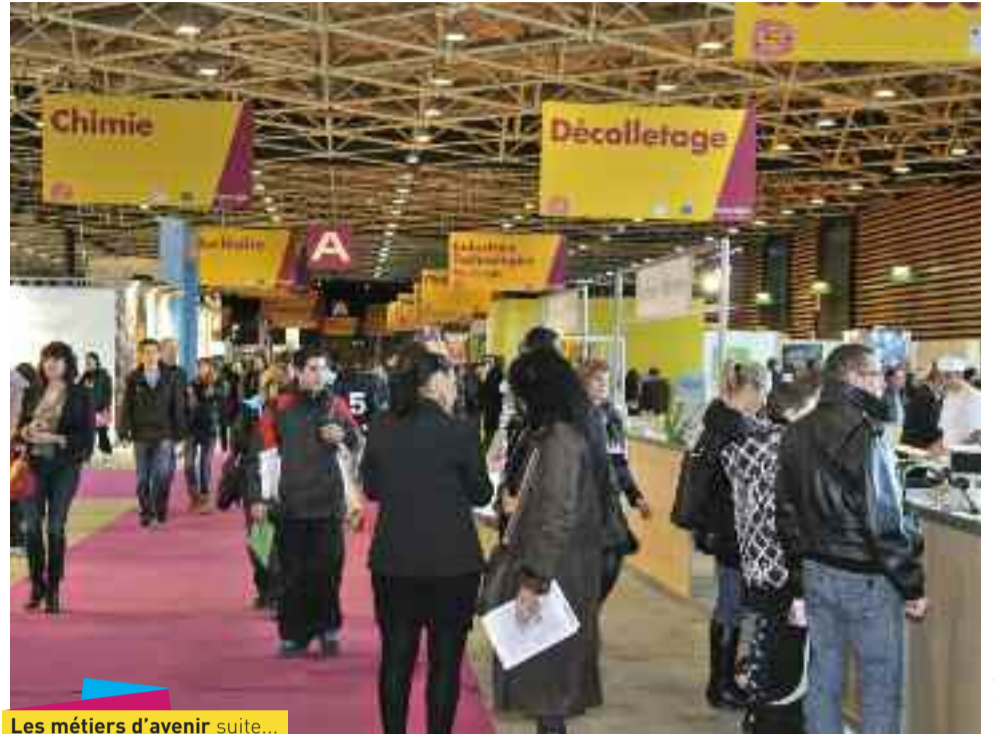
Les métiers d'avenir suite...

assurances restent également bien lotis – le taux d'insertion professionnelle des diplômés de Master banque et finance de l'université est de 90%, malgré leur image un peu ternie par la crise. Dans tous les cas, pour prendre le pouls du marché de l'emploi dans la région, nous vous invitons à consulter la liste de métiers utilisée pour la mise en place des Emplois d'avenir (les nouveaux Emplois jeunes) en Rhône-Alpes. Pour l'établir, la préfecture a identifié les métiers en « tension de recrutement », c'est-à-dire pas forcément liés à des secteurs en développement mais caractérisés par un déséquilibre de l'offre et de la demande, des départs en retraite... À sa lecture, il apparaît que les secteurs d'activité prioritaires dans la région sont : les services à la personne, l'économie verte (métiers du recyclage, de la construction à faible impact environnemental, de l'agriculture et du jardinage), l'économie sociale et solidaire, l'industrie et l'économie de la montagne.